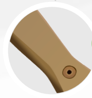
1 Mango de madera