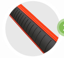
2 Mango o agarradera